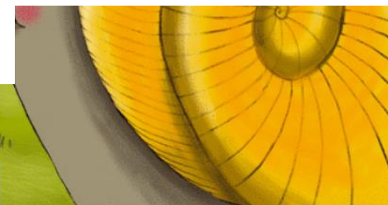
Illustration de l'escargot à rêver, Infomedia Communication